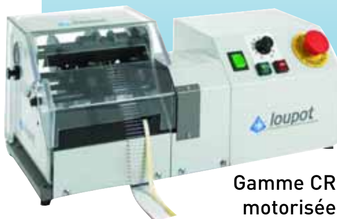
Gamme CR motorisée